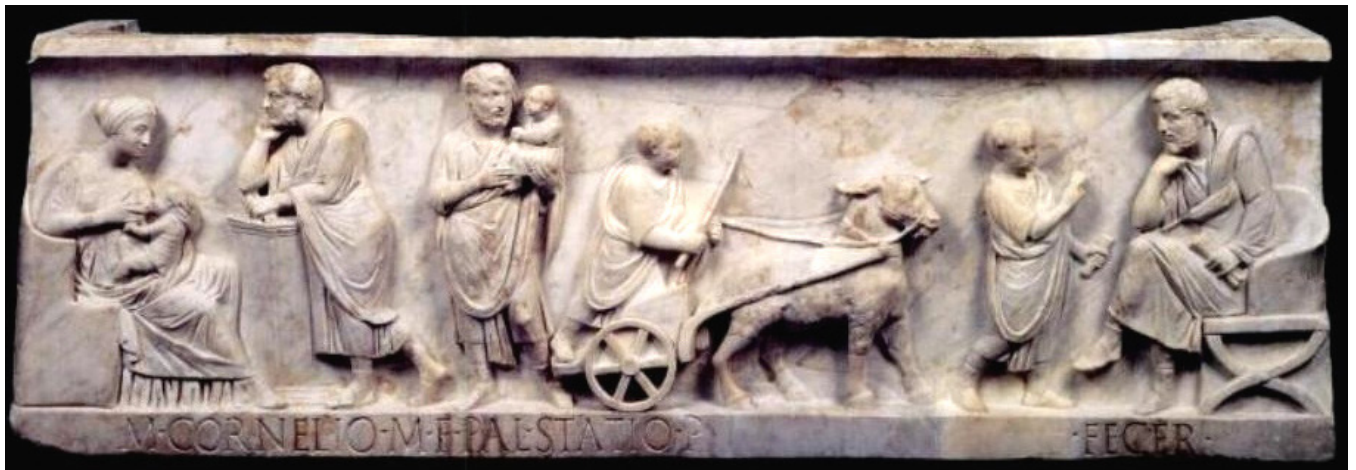
Picture 1 Stages in growing-up, illustrated on a sarcophagus

Candidates should study the following pictures, one or more of which will be used as a basis for questions in each question paper.