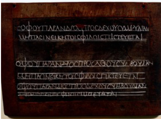
Picture 4 Writing exercise on a wax tablet