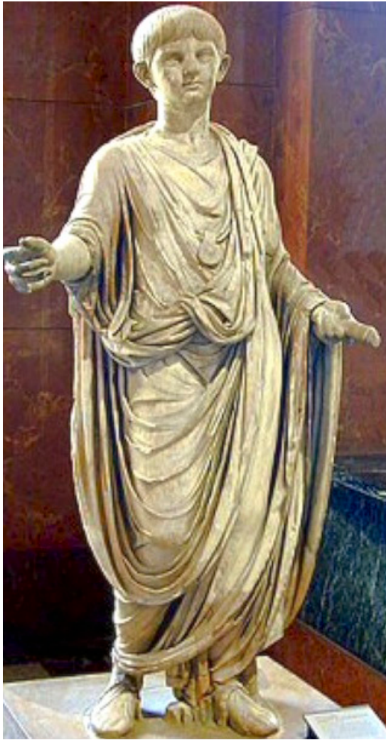
Picture 3 A boy orator